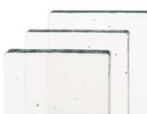
35 470 21 1101-65F klar / clear