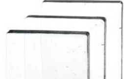
35 470 00 1401-65F kristallklar / crystal clear