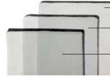
35 470 15 1829-65F blass grau / light gray