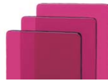
35 470 16 1831-65F blass rubinpink striker / ruby pink striker