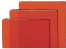
35 470 11 1823-65F blass rötelt striker / burnt scarlet striker