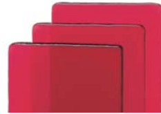
35 470 12 1824-65F blass rubinrot striker / ruby red striker