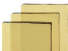
35 470 20 1867-65F blass oliv rauch / olive smoke