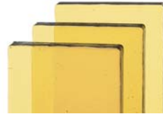
35 470 14 1827-65F blass hell amber / light amber