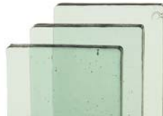
35 470 01 1806-65F blass rauchblaugrün / juniper blue