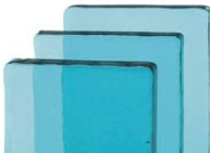
35 470 03 1808-65F blass aquamarin / aqua blue