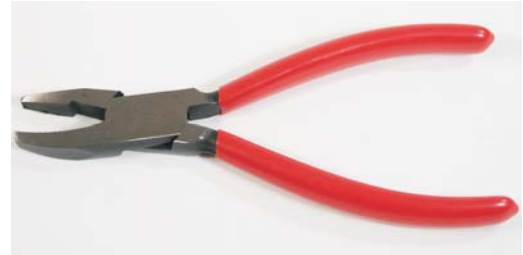
32 125 00 KNIPEX Brech- und Kröselzange, 160 mm Länge, 5 mm Backenbreite, ölgehärtete Backen, ummantelter Griff Breaking and grozing pliers, 160 mm l., 5 mm jaw width oil tempered jaw, coated grip