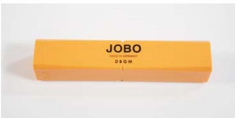
32 155 00 JOBO Glasbrechstab JOBO glass breaking device