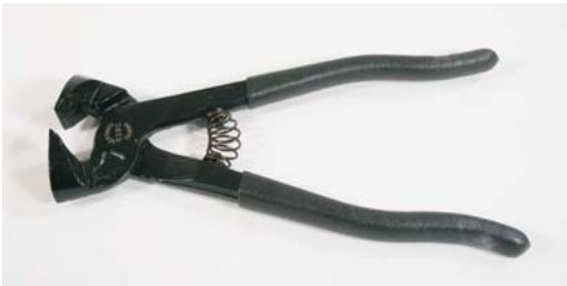
32 165 00 Mosaik Glasbeißer / Mosaic glass nibbler