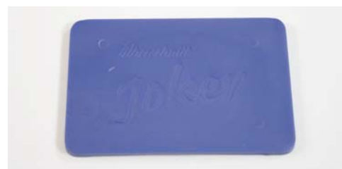
36 165 00 JOKER Silberschnitt Brechhilfe JOKER glass breaking device