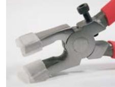
32 115 00 PROVETRO PRP-1 (für / for 2 - 6 mm Glas / glass) Laufzange 205 mm L., 24 mm Backenbreite, Metall, mit Stellschraube, Griff und Backen ummantelt Running pliers, 205 mm, 24 mm jaw width, metal, leveling screw, coated grip and jaw