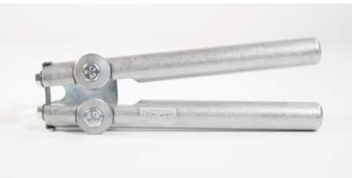
00 311 00 ZAG-ZAG "Junior" Mosaik-Zange, das einfache Einsteigermodell Bruchkanten- korrektur ZAG-ZAG "Junior" Mosaic pliers .The basic model for beginners for correction of breaking