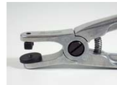
32 150 00 SILBERSCHNITT Laufzange, 700.0 Metall / Running pliers, 700.0 metal