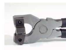
32 117 10 PROVETRO PRP-4 (für / for 4 - 19 mm Glas / glass) Dickglas Laufzange, 230 mm L., 50 mm Backenbreite, ummantelter Griff / Pliers for thick glass 230 mm, 50 mm jaw width, coated grip