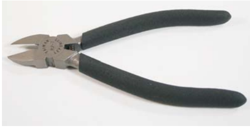
32 170 00 Bleiseitenschneider PLP 7 / Lead came cutter