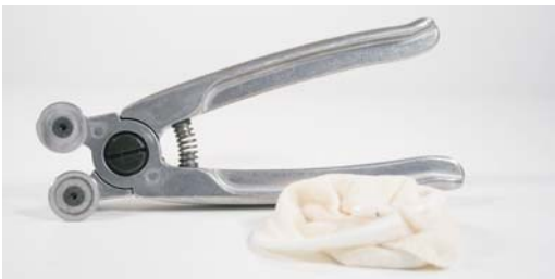
32 160 00 ZAG-ZAG Mosaik-Zange ZAG-ZAG Mosaic pliers