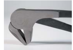
32 118 10 PROVETRO P-310 (für / for 3 - 12 mm Glas / glass), Dickglas Brechzange, 210 mm Länge, 23 mm Backenbreite, ummantelter Griff / Pliers for thick glass, 210 mm, 23 mm jaw width, coated grip