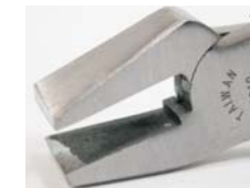
32 118 00 PROVETRO P-210 (für / for 3 - 12 mm Glas / glass) Dickglas Brechzange, 220 mm, 22 mm Backenbreite, ummantelter Griff / Pliers for thick glass, 220 mm, 22 mm jaw width, coated grip