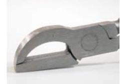
32 118 20 PROVETRO P410 (für / for 3 - 12 mm Glas / glass) Spiegeldickglasbrechzange, 185 mm Länge, 15 mm Backenbreite, ummantelter Griff / Breaking pliers for mirrors, 185 mm, 15 mm jaw width, coated grip