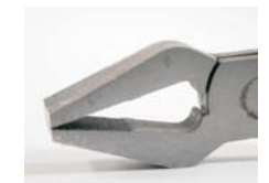
32 118 30 PROVETRO P-510 (für / for 3 - 16 mm Glas / glass) Dickglas Brechzange, 210 mm, 23 mm, Backenbreite, ummantelter Griff / Pliers for thick glass, 210 mm, 23 mm jaw width, coated grip