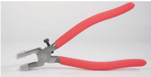
32 115 11 Ersatzpaarschuhe für 32 115 00 Replacement tip for 32 115 00 32 115 12 Ersatzpaarschuhe für PRP-7 Replacement tip for PRP-7