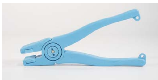
32 111 02 RING STAR Ersatzbacken, Replacement jaw,