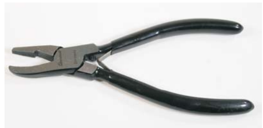
32 126 00 BOHLE Kröselzange, 160 mm Länge, 4 mm Backenbreite, kunststoffüberzogene Griffe, Kopf geschliffen, Rückstell feder für selbsttätiges Öffnen der Backen. Grozing pliers, 160 mm, 4 mm jaw width, plastic coated handles, ground head, with pull-back spring for automatic opening of the jaws.