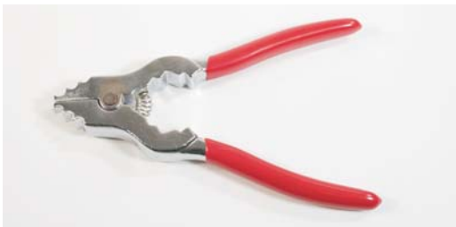
32 190 00 Kettenzange / Pliers for chains