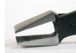
32 140 00 KNIPEX Brechzange, 180 mm, 22 mm Backenbreite, erleichtert das Brechen von schmalen Streifen Breaking pliers, 180 mm, 22 mm jaw width, easy breaking of small strips