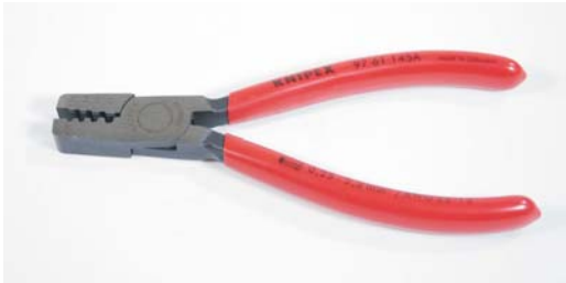
32 186 00 KNIPEX Aderendhülsen-Zange / Crimping pliers for cable links