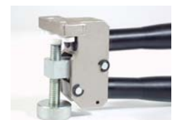
32 119 00 BOHLE Schnittlaufzange (für / for 6 - 15 mm Glas / glass) Ganzmetall, mit Stellschraube zur individuellen Einstellung auf die jeweilige Glasdicke, optimale Kraftübertragung, ideal auch für das Öffnen gerader Schnitte und Eckausschnitte etc.

Cut runnig plier. All metal, with adjustable screw to set to individual glass thickness, optimum load transmission, also ideal to open straight cuts, corner cut outs, etc.