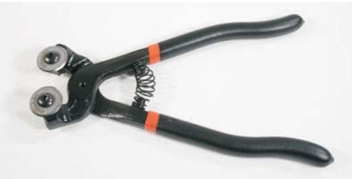
32 166 00 Glasbeißer BOHLE ZAG ZAG für Mosaikarbeiten Glass nibbling pliers for mosaic works