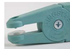
32 111 00 RING STAR Laufzange, Kunststoff Running pliers, plastic