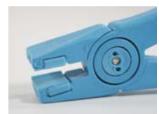
32 101 00 BLUE RUNNER Laufzange, Kunststoff Running pliers, plastic