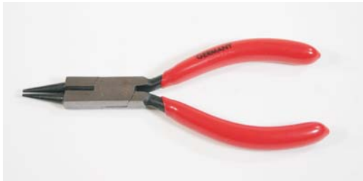
32 185 00 KNIPEX Schmuckbiegezange, mini / Needle nose pliers, mini