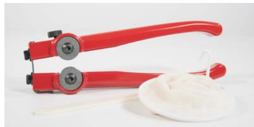
00 310 00 ZAG-ZAG Mosaik-Zange, Mosaic pliers

have two overlapping cutting wheels. This makes it possible to cut forms out of glass similar to using a pair of scissors. The cutting wheels are adjustable and have a proven long life. These pliers are excellent for the production of glass mosaics and for construction of lamps which contain small glass pieces.