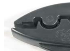
32 112 01 Laufzange "Snappers" / Runner pliers "Snappers"