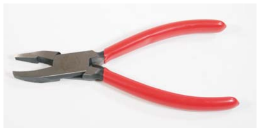
32 127 00 KNIPEX Brech- und Kröselzange, 160 mm Länge, 4 mm Backenbreite, ölgehärtete Backen, ummantelter Griff Breaking and grozing pliers, 160 mm, 4 mm jaw width, oil tempered jaw, coated grip