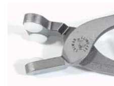
32 117 00 PROVETRO PRP-2N (für / for 6 - 12 mm Glas / glass) Dickglas Laufzange, 230 mm Länge, 45 mm Backenbreite, Backn mit Kunststoff belegt, ummantelter Griff Pliers for thick glass, 230 mm, 45 mm jaw width, plastic tips, coated grip