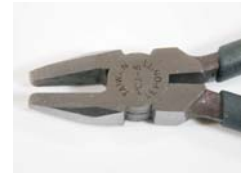
32 134 00 PROVETRO PCJ-8, Fischlippen-Kröselzange, 165 mm, 5 mm Backenbreite, ummantelter Griff (ideal für 2 - 5 mm Glas) Grozers pliers "Fishlip", 165 mm, 5 mm jaw width, coated grip, (for 2 - 5 mm glass)