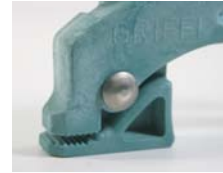
32 112 00 Glasgreifer, fixiert beim Schleifen auch kleinste Glasstücke problemlos Glass Holding pliers securely grips small glass pieces while grinding