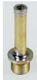
Diamant Hohlbohrer mit Außen- kühlung für Adapter 30 211 00 Diamond core drill bit with outer cooling for adaptor 30 211 00