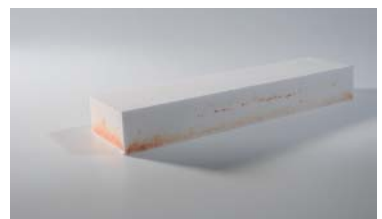
30 270 20 Schärfstein Block / Sharpening Stick 25 x 8 x 50 mm