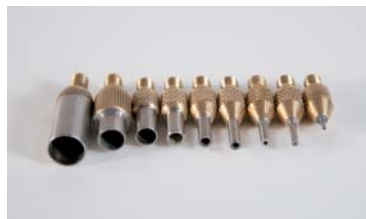
Diamant-Hohlbohrer Gegenstück Diamond hollow drill