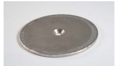
30 271 01 Metallplatte für Magnetfuß Metal Bar for Magnetic Base