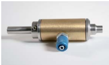
30 270 00 Spindel für Diamanthohlbohrer mit automatischen Kernausstößer für jedes Bohrsystem / Small drilling Adapter with automatic core ejector for all drilling systems