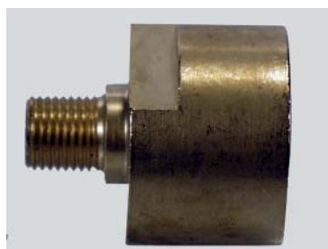
30 252 01 Dieser ADAPTER wird benötigt, wenn Fremdbohrer (Belgisches Gewinde) in unserem System verwendet werden sollen (1/2" Außen, 10 mm Innen). This adapter is required if foreign drill bits (Belgian thread) are used with our system (1/2" outside, 10 mm inside).