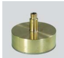
Glasbohrer mit Innenkühlung für Bohrsystem Drill bit with inner cooling for drilling system