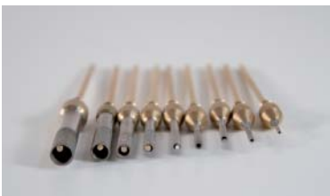
Diamant-Hohlbohrer Diamond hollow drill