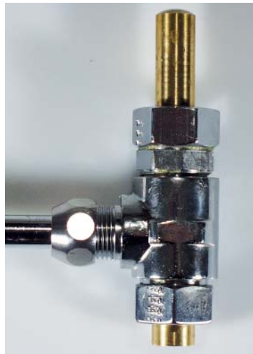
30 255 00 Spülkopf für Glasbohrer Swivel head for glass drills

Complete drilling system For the use of our swivels and our drills, no adapter is required!