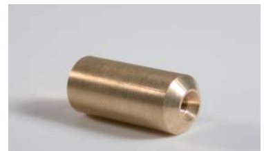
30 271 02 Metalleinsatz Gegenstück Metall Application Counterpart