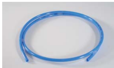
30 270 11 Hochdruckschlauch für 30 270 00 High Pressure Hose for 30 270 00