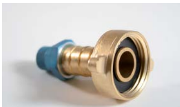
30 270 10 Wasseranschluss für 30 270 11 Water Connection for 30 270 11