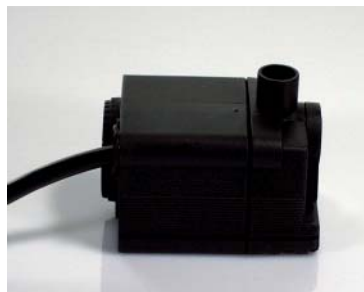
30 258 00 Wasserpumpe für Spülkopf Water pump for swivel head