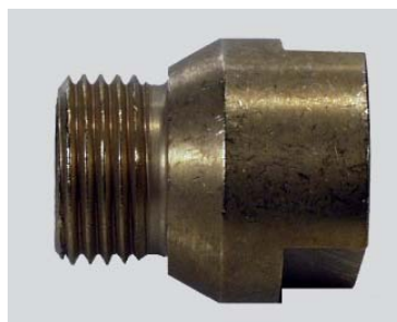
30 252 00 Dieser ADAPTER wird benötigt, wenn unsere Bohrer in einer industriellen Bohrmaschine verwendet werden sollen. This adapter is required if our drill bits are used in an industrial drill.