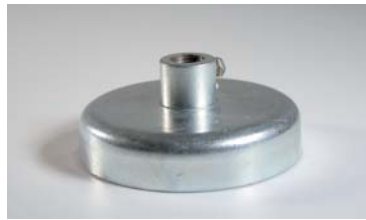
30 271 00 Magnetfuß für Mini-Bohrsystem Magnetic Base for Mini-Drill