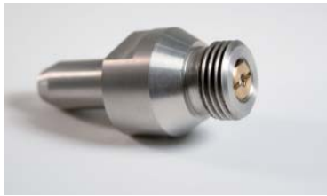
30 270 01 Spühlkopfadapter für Profi-Bohrsysteme, 1/2" auf Aufnahme Adapter System (1/2") for profi drilling system