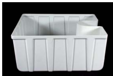
30 259 00 Wasserwanne für Bohrmaschine Water tub for swivel head