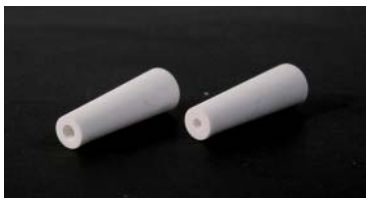
51 351 xx Keramik-Strahldüse / Ceramic nozzle