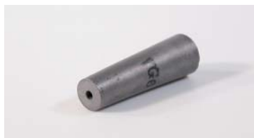
51 351 11 Carbid-Strahldüse / Carbide nozzle