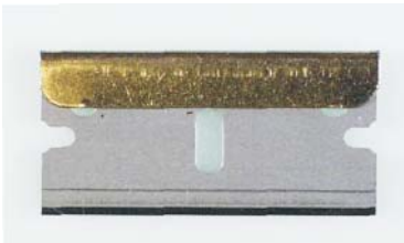
36 251 02 MARTOR Klingenschaber / Glass ductor