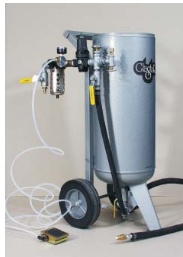
51 302 00 GLASTAR-Druckbehälter mit Fuß- schalter Pressure pot with foot switch