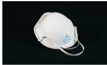
35 607 15 Feinstaubmaske Fine dust respirator