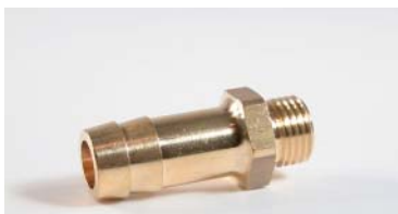
51 652 05 Schlauchverschraubungen Threaded hose coupling