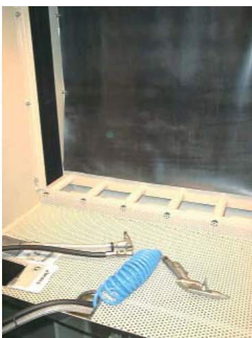
Innenansicht / Interior view

51 330 30 Großglasstütze für 51 330 00, rechts oder links Large glass supports for 51 330 00, right or left Maße / dimensions B: 75 cm H: 88 cm