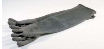
51 317 00 Roßhaarbürste / Horsehair cabin brush 36 521 00 Gummihandschuhe / Rubber gloves