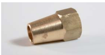
51 352 20 Überwurfmutter für Düsenaufnahme Nozzle cap