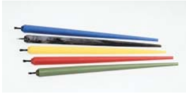
51 450 00 Schlingmesser-Set, 5 Stärken Parallel line cutter set, 5 sizes