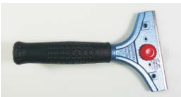
36 250 00 MARTOR Glasschaber / Glass ductor