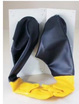
51 355 00 Adapterhandschuhe komplett mit Blech Sandblasting gloves with metal shield