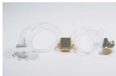
51 305 00 Fußschaltersystem Foot switch system