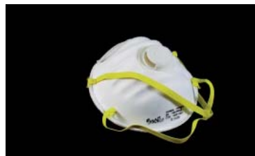
35 607 20 Feinstaubmaske mit Auslaßventil Fine dust respirator, with valve