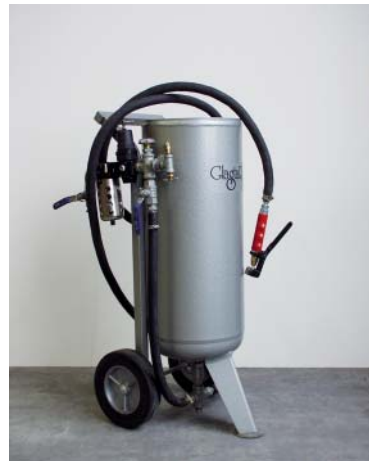
51 301 00 GLASTAR-Druckbehälter mit Handschalter Pressure pot with hand switch