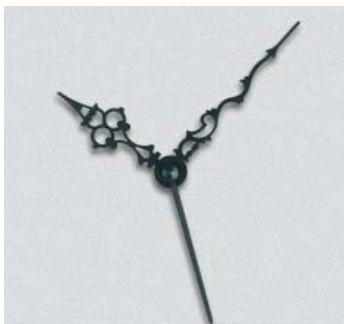
Zeigersatz, verziert, Metall, 9,5 cm Hands set, antique, metal, 9,5 cm 55 136 00 Schwarz / black