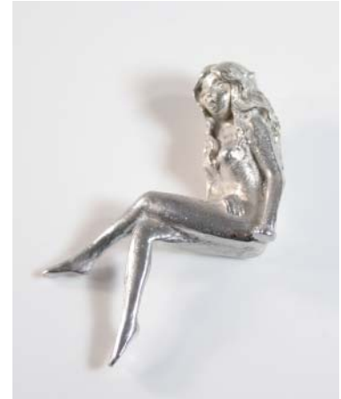
27 911 00 Bleikörper "Sitzende Elfe" Lead sculpture "Sitting Fairie" ca./approx. 7,5 cm