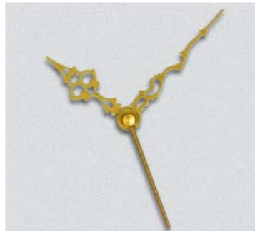
Zeigersatz, verziert, Metall, 9,5 cm Hands set, antique, metal, 9,5 cm 55 136 02 Gold / gold