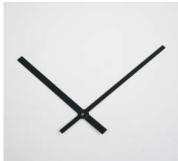
55 135 00 Schwarz / black Zeigersatz, Metall, 18,0 cm Hands set, metal, 18,0 cm