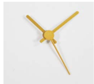
Zeigersatz, kurz, Metall Hands set, short, metal, 5,2 cm 55 134 00 Schwarz / black 55 134 01 Weiß / white 55 134 02 Gold / gold 55 134 03 Silber / silver