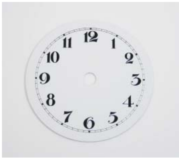
55 160 00 Ziffernblatt "Katzenuhr", Weiß Clock face "Cats Clock", white Ø 10 cm