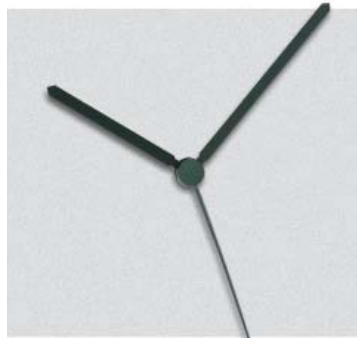
Zeigersatz, lang, Metall Hands set, long, metal, 8,5 cm 3-teilig / 3 parts 55 132 00 Schwarz / black 55 132 02 Gold / gold 55 132 03 Silber / silver