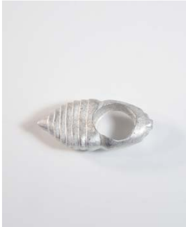
27 909 00 Bleikörper "Käfer" Lead sculpture "Scarabeus" ca./approx. 5 cm