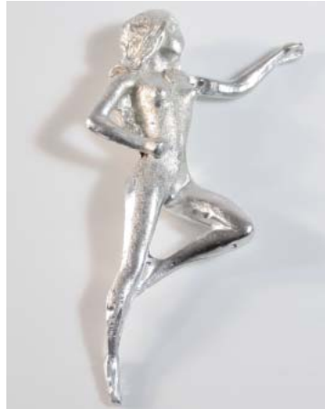
27 910 00 Bleikörper "Fliegende Elfe" Lead sculpture "Flying Fairie" ca./approx. 9 cm