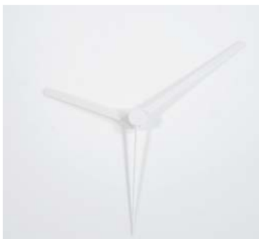
Zeigersatz, Kunststoff, 8,5 cm Hands set, plastic, 8,5 cm 3-teilig / 3 parts 55 130 00 Schwarz / black 55 130 01 Weiß / white