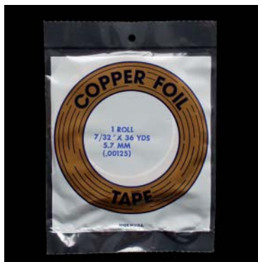
Kupfer, Klebeseite Schwarz Copper, black coated