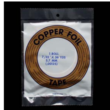
Kupfer, Klebeseite Silber Copper, silver coated